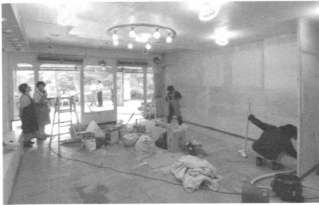
多くの人々の協力により行われた移転作業