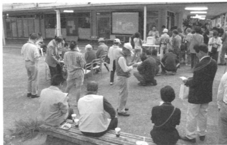
毎年10月の周年記念行事