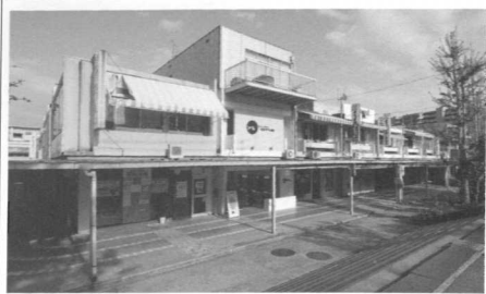
新千里東町の近隣センター