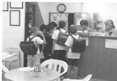
学校帰りに水を飲みに立ち寄る子どもたち

「街角広場」の日々の運営は2～3人のボランティアによって担われているが、ボランティアとそれ以外の来訪者との関係が固定さ