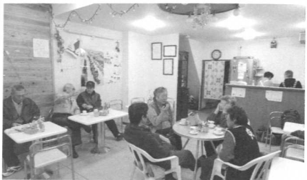
思い思いに過ごす人々