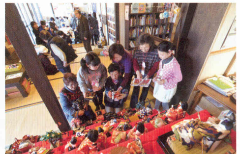
写真③ ひな祭りでは子どもと一緒に段飾りのひな人形を飾った