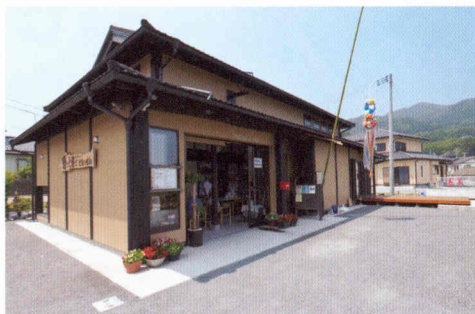
写真① 古民家を移築・再生した建物