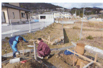
写真⑥ かつて建築関係の仕事をしていた人が中心となり屋外にキッチンを増築