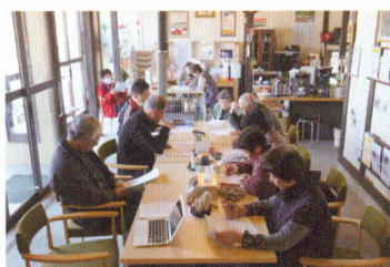
写真⑥ 毎月欠かさず開催されている運営のための定例会

ここで考えたいのは地域の資源を運営に活かすことの意味である。コミュニティ・カフェやパブリックシェルターなどの場所では、地域の資源を運営に活かすことが必要だと言われ、既に述べ