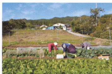
写真⑤ 休耕地を活用した農園（居場所ファーム）