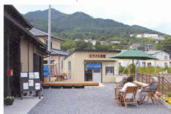
写真⑦ 完成した屋外のキッチン（写真正面）