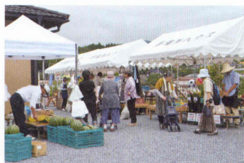
写真④ 毎月開催している朝市は多くの人で賑わう

地域の人々は「居場所ハウス」に対して次のように多様なかたちで関わっている。まずあげられるのが運営のための定例会である（写真⑧）。定例会はオープン直後の2013年6月29日から毎月欠かさず開かれており、運営で生じた出来事の情報共有、イベントに向けた打合せ、運営のあり方についての意見交換などを行っている。定例会の参加資格をもうけているわけではないが、