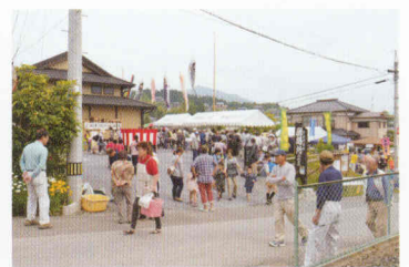
写真⑪ 二周年記念感謝祭に集まる人々