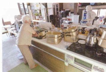
写真⑨ キッチンで鍋を洗う女性