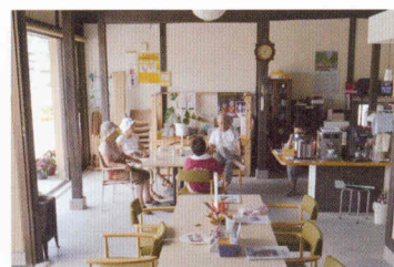
写真⑩ パートスタッフも他の人と一緒に話をしながら過ごす