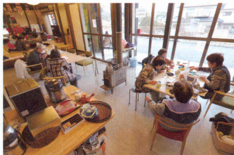
写真② 地域の人々が思い思いに過ごす